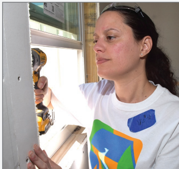
Assurant se enorgullece de apoyar a Habitat for Humanity. Aquí, un miembro del equipo de marketing de Assurant toma un descanso de su trabajo de todos los días para instalar paredes.

Sentido común, conducta adecuada, una forma de pensar distinta y resultados extraordinarios guían la forma en que apoyamos a nuestros clientes y colaboramos unos con otros.